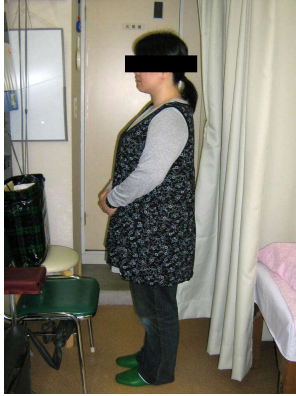
ウェスト 22.1センチ減 8ヵ月後